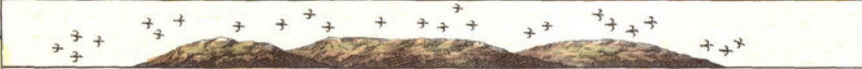
Klein CURACAO siet men int z.w. ten z., en is heel laag land, legt maer even boven Water, jõe dat men het by nacht niet wel sien kan: Ontrent die Eyland heeft men veel geregelde genaamt MALLEN OCCA. Waer-aan ge geraer wert, dat ge dicht onder dat Eyland zyt.

Nieuwe Afspeekening Van het Eyland CURACAO. Vertoene alle deesjelsj vetecontheeden Mitsaders 't haven van ST. ANNA en 't FORT AMSTERDAM Int groed, als eok hoe Sij dit Eyland uyt oer Zee vertoont. Tot AMSTERDAM by GERARD VAN KEULEN. Aen de Nieuwen Brugh. Met Privilegie.